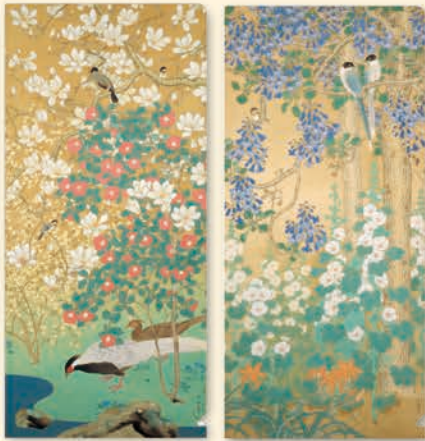
荒木十畝 《四季花鳥》のうち 春(華陰鳥語)