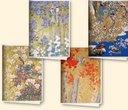
荒木十畝 《四季花鳥》のうち 春(華陰鳥語)