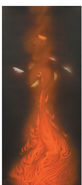
速水御舟 《炎舞》 【重要文化財】 Hayami Gyoshū Dancing in the Flames [Important Cultural Property]

御舟の最高傑作《炎舞》【重要文化財】を、華やかな色使いのきんとんで表現したカフェ椿の自信作。黒糖風味の大島あんは重厚な味わいです。(黒糖風味大島あん)