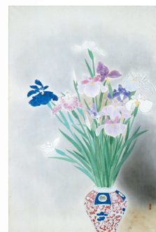
小林古徑 《菖蒲》 Kobayashi Kokei Iris

古徑が描いた端正な花菖蒲。白く涼やかな淡雪羹を画中の古伊万里の壺に見立て、紫と緑の錦玉で大ぶりの菖蒲を表しました。(淡雪羹・錦玉羹) ※卵を使用しています。