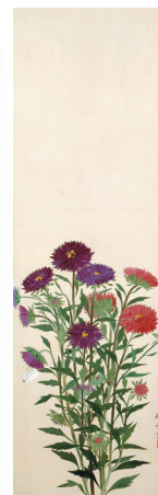
速水御舟 《和蘭陀菊図》 Hayami Gyoshū Chrysanthemums

菊の花と羽を休める蝶をモチーフにしました。まさり草は菊の古名です。中は風味豊かな胡麻入りのこしあん入り。(胡麻入りこしあん・淡雪羹) ※卵を使用しています。