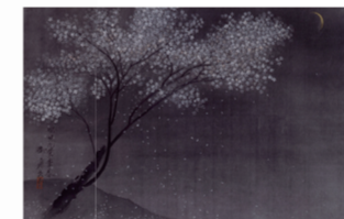
速水御舟 《あけぼの・春の宵のうち 「春の宵」》

Hayami Gyoshū Spring Evening: from Dawn and Spring Evening