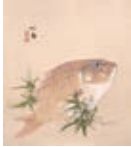
竹内栖鳳 《坤影帖・色紙十二月》 のうち「鯛(1月)」

竹内栖鳳が描いた鯛の姿をモチーフに、おめでたいお菓子をつくりました。中は菊家特製の上品なこしあんです。(こしあん)