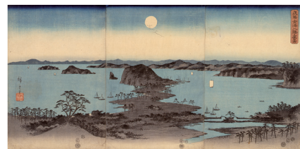
歌川広重 《武陽金沢八勝夜景 (雪月花の内月)》

Utagawa Hiroshige I Night View of Eight Scenic Spots at Kanazawa: Moon, from Snow, Moon, and Flower