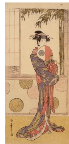
勝川春章 《四代目岩井半四郎のおかる》 Katsukawa Shunshō Iwai Hanshirō IV in the Role of Okaru

役者・岩井半四郎が手にしている団扇をかたどりました。可愛らしい色合いと、菊家らしい上品で控えめな甘味が魅力の和菓子です。 (こしあん)