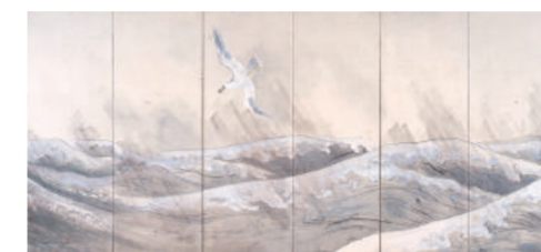
橋本関雪 《生々流転》(部分) Hashimoto Kansetsu Metempsychosis (detail)

風雨に荒れる海原を描いた関雪渾身の大作をモチーフにしたきんとんです。 錦玉羹で作った海鳥を添えました。 (黒糖風味大島あん)