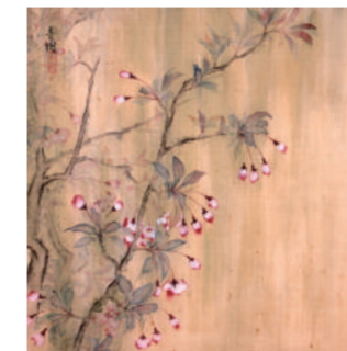
小茂田青樹 《春雨》 Omoda Seiju Spring Rain

雨に濡れた かいどろ 海棠の花を清涼感あふれる姿に表しました。 控えめな甘さの、可愛らしい和菓子です。 (錦玉羹・淡雪羹・白あん) ※卵を使用しています。