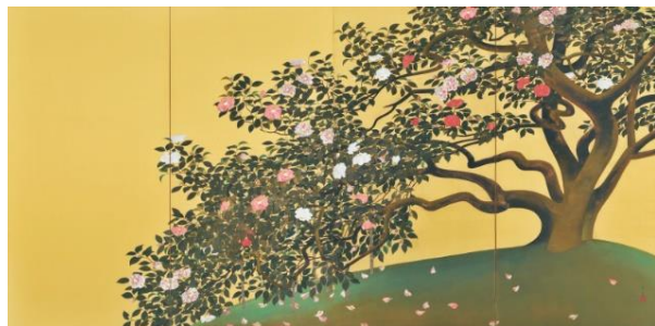
速水御舟《名樹散椿》【重要文化財】1929(昭和 4)年 山種美術館〔画像請求 No. ④〕

映画、小説、漫画やアニメなどの舞台になった場所を訪れる「聖地巡礼」。2023 年、当館では、画題となった土地や、画家と縁の深い場所を「聖地」とし、その土地が描かれた作品と、現地の写真をあわせて展示する「日本画聖地巡礼」展を開催し、多くの方にご好評をいただきました。このたび、満を持して「日本画聖地巡礼」展の第 2 弾を開幕します。