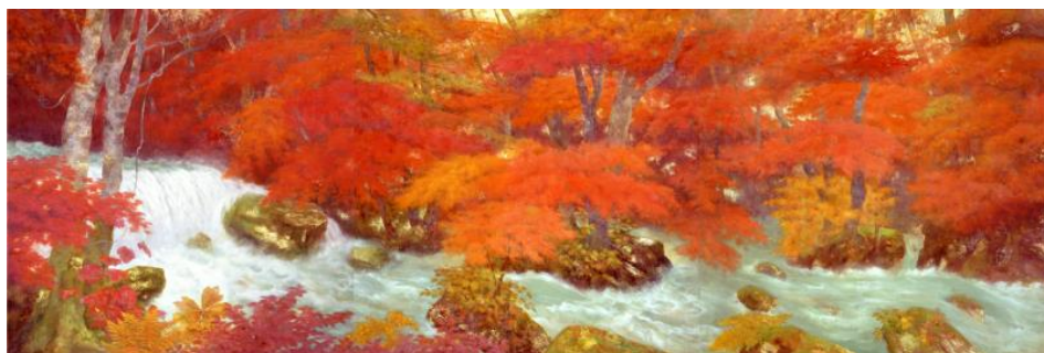
奥田元宋《奥入瀬(秋)》1983(昭和 58)年 山種美術館〔画像請求 No. ①〕