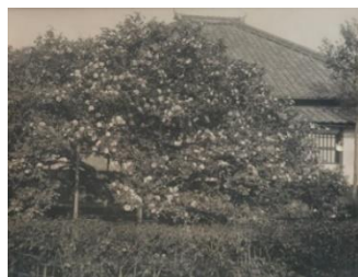
五色八重散椿初代

【重要文化財】、定宿から見える京都の町家の光景を表した東山魁夷《年暮る》をはじめ、実際の場所を題材とした日本画の名作をご紹介します。また、今回新たに選んだ作品も多数登場します。なかでも、皇居を中心に、東京を俯瞰する視点で描き出した山口晃《東京圖 1・0・4 輪之段》は、当館の所蔵品となって以来、初めての展示となります。