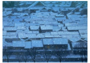
左より:《春静》1968(昭和 43)年、《緑潤う》1976(昭和 51)年、《秋彩》1986(昭和 61)年、《年暮る》1968(昭和 43)年 全て東山魁夷、山種美術館 [画像請求 No. ⑤-⑧]