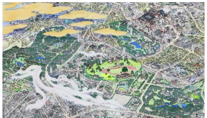
山口晃《東京圖 1・0・4 輪之段》(部分)

撮影: 宮島 啓 ©YAMAGUCHI Akira, Courtesy of Mizuma Art Gallery