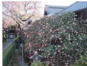
五色八重散椿第二世

さらに、前回日本全国の「聖地」をご覧いただきましたが、本展では、日本だけでなく海外にも視野を広げます。中国・蘇州の水郷をみずみずしい筆致で表した竹内栖鳳《城外風薫》、霧に包まれたイギリス・ロンドンのタワーブリッジを捉えた平山郁夫《ロンドン霧のタワー・ブリッジ》、晴天の下に立つエジプトのピラミッドを描いた千住博《ピラミッド「遺跡」》など、世界の「聖地」をご堪能ください。