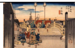
歌川広重(初代) 《東海道五十三次之内 日本橋・朝之景》