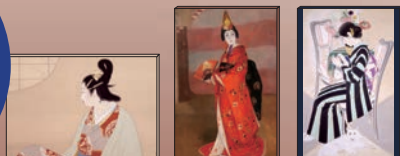
上村松園 「円窓美人」