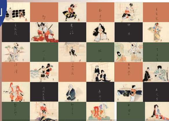
木村莊八「歌舞伎もの十八番」