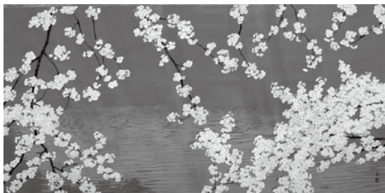
石田武《千鳥ヶ淵》2005(平成17)年 紙本・彩色

日本の国花として知られる桜の絵画が満開となる美術館で、花の競演とお花見を楽しんでいただければ幸いです。