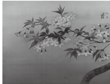
速水御舟《夜桜》1928(昭和3)年 絹本・彩色