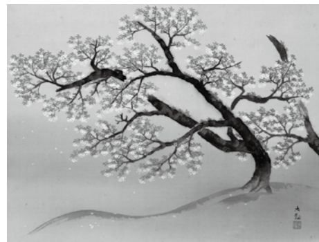
横山大観《山桜》1934(昭和9)年 絹本・彩色