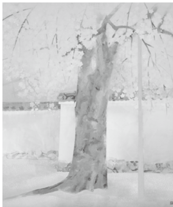
奥村土牛《醍醐》1972(昭和47)年 紙本・彩色