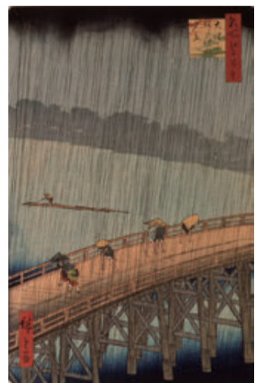
歌川広重 《名所江戸百景 大はしあたけの夕立》 〈7/15～8/24展示〉

雨にぬれる橋と江戸の情緒を梅酒風味の錦玉羹で表現しました。梅の実の食感もお楽しみください。（梅酒風味錦玉羹）