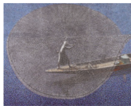
宮廻正明 《水火花(螺)》

水面にきらめきながら広がる投網をイメージし、黒糖風味のきんとんに仕上げました。（特製大島あん）