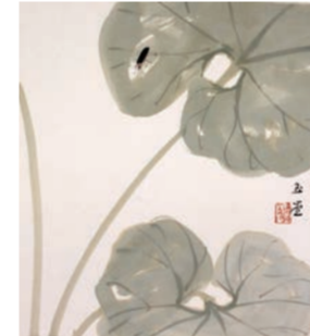
川合玉堂 《ふき》 (前期展示)

ふきの葉の艶やかなようすを初夏らしい涼しげな和菓子に仕上げました。(柚子風味錦玉羹・白あん入り)