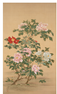
鈴木其一 《牡丹図》個人蔵 〈前期展示〉

華の王とも呼ばれる牡丹。その華麗な姿を端正な練り切りで表現しました。(こしあん)