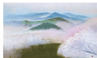
奥村土牛 《吉野》山種美術館蔵 〈全期間展示〉