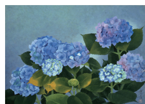
山口蓬春 《梅雨晴》山種美術館蔵 〈全期間展示〉

朝露とあじさいの鮮やかな輝きをさっぱりとした寒天で仕上げました。涼しげな初夏の和菓子です。(梅酒風味錦玉羹・白あん)