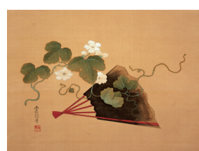
酒井抱一 《扇面夕顔図》個人蔵 〈前期展示〉

扇にのせられた夕顔は『源氏物語』に登場するエピソード。しっとりと咲く美しい風情をモチーフにしました。中は爽やかな緑色の柚子あんです。色のコントラストもお楽しみください。(柚子あん)