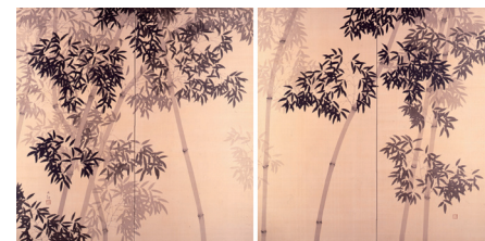
横山大観 《竹》 (山種美術館) 〈全期間展示〉

雪のような淡雪羹に鮮やかな緑で宗達や大観が描いた竹林を表現しました。やさしい食感をお楽しみください。(淡雪羹)