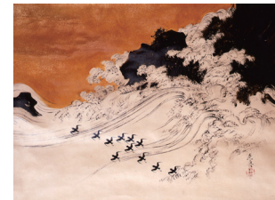
柴田是真 《浪に千鳥》 (山種美術館) 〈全期間展示〉

海原を背景に飛翔する千鳥をモチーフにしてみました。杏をあしらった練切りの爽やかな風味をどうぞ。(杏入り練切り・こしあん)