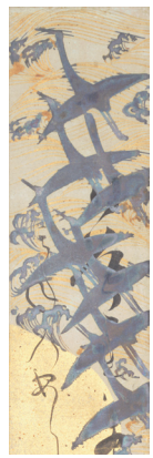
俵屋宗達・本阿弥光悦 《四季草花下絵 和歌短冊帖》より 「千羽鶴」 (山種美術館) 〈後期展示〉

加山又造《千羽鶴》(山種美術館ロビー常設)や短冊に俵屋宗達が描いた、波濤に飛ぶ鶴の華麗な様子をきんとんにしました。しっとりとした甘さのお菓子です。(特製大島あん)