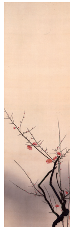
速水御舟 《紅梅・白梅》のうち「紅梅」 (山種美術館) 〈全期間展示〉

馥郁と香りながら早春を告げる紅梅を表した季節感いっぱいのやさしい上生菓子です。(こしあん)