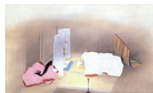
小林古径 《清姫》のうち「寝所」 Kobayashi Kokei Scenes from the Legend of Kiyohime: Sleeping Quarters