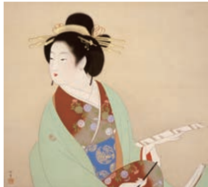
上村松園 《詠歌》 Uemura Shōen Composing a Poem

思索しながら和歌を詠む女性。手に持つ短冊をあしらい、画中の着物の色に合わせたきんとんに仕上げました。あんは上品な甘さの黒糖風味。(黒糖風味大島あん)