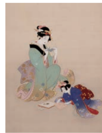
上村松園 《折鶴》(部分) Uemura Shōen Girls Folding Paper Cranes (detail)

二人の少女が興じる折り紙遊び。折鶴をモチーフにした可愛らしい風情の和菓子です。なめらかな食感もお楽しみください。(羊羹入り淡雪羹・錦玉羹)