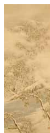
森寛斎 《雪中嵐山図》 Mori Kansai Arashiyama in the Snow

京都・嵐山の雪景色を描いた一幅。 川辺に降り積もった雪を粉糖で表しました。 静かな冬の風情を感じさせるひと品です。 (こしあん) Smooth sweet bean paste