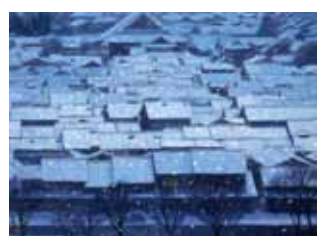
東山魁夷 《年暮る》 Higashiyama Kaii End of the Year

しんとんと古都に降る雪と町屋の屋根を、 きんとんと錦玉羹で表現しました。 中は上品な甘さの大島あんです。 (黒糖風味大島あん) Red bean paste with brown sugar flavor.