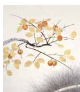
小林古径 《秋采》 Kobayashi Kokei Autumn Fruit

移りゆく秋の情景を描いた作品から、 色づく柿の様子をかたどりました。 菊家特製のこしあんは控えめな甘さです。 (こしあん) Smooth sweet bean paste ※柿の味ではありません。