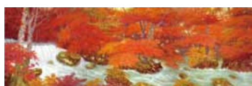
奥田元宋 《奥入瀬(秋)》 Okuda Gensō Oirase Ravine: Autumn

秋の溪流を華やかに彩る紅葉と水しぶきを、 美しい和菓子に仕上げました。 色鮮やかな黄緑色の柚子あん入りです。 (柚子あん) Smooth sweet yuzu citrus flavored bean paste.