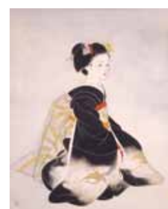
奥村土牛 《舞妓》 Okumura Togyū Maiko, Apprentice Geisha

舞妓の着物に舞う金色の鶴。 華やかな袖の中に、 風味豊かな胡麻入りのこしあんを包みました。 (胡麻入りこしあん) Smooth sweet bean paste mixed with sesame paste. ※卵を使用しています。It contains egg