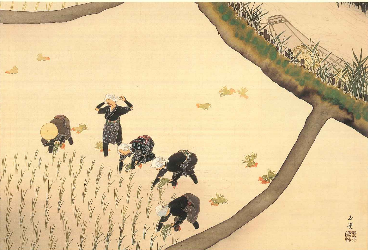
▲川合玉堂「石捕花」、1930(昭和5年) ▲川合玉堂「早乙女」、1945(昭和20年)