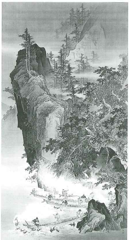
川合玉堂《鶴岡》、1895(明治28)年