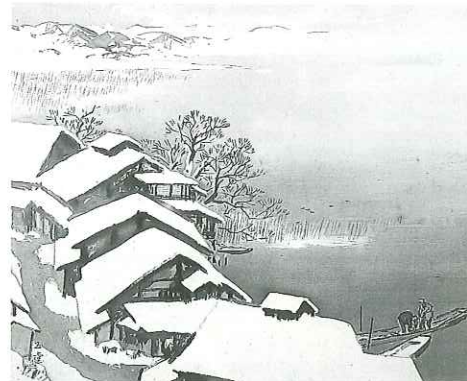
川合玉堂《湖畔暮雪》、1938(昭和13)年