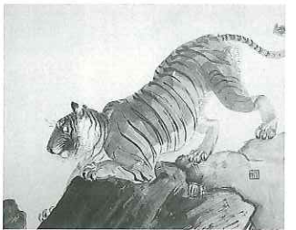
川合玉堂《虎》、1943(昭和18)年頃