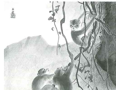
川合玉堂《猿》、1955-56(昭和30-31)年頃