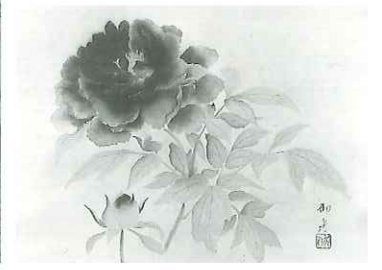
(表面) 左上 | 重要文化財 竹内栖鳳《班猫》大正13年 | Takeuchi Seiho Tabby Cat (Important Cultural Property) 1924 右上 | 重要文化財 速水御舟《炎舞》大正14年 | Hayami Gyoshu Dancing Flames (Important Cultural Property) 1925 下 | 重要文化財 速水御舟《名樹散椿》昭和4年 | Hayami Gyoshu Falling Camellias (Important Cultural Property) 1929 (裏面) 左上 | 横山大観《心神》昭和27年 | Yokoyama Taikan Mt. Fuji (Spirit of God) 1952 左下 | 村上華岳《裸婦図》大正9年 | Murakami Kagaku Woman in the Nude 1920 右上 | 上村松園《鮎》昭和13年 | Uemura Shūen Scene from a Noh Play "Kinuta" 1938 右下 | 速水御舟《牡丹花(墨牡丹)》昭和9年 | Hayami Gyoshu Black Peonies 1934