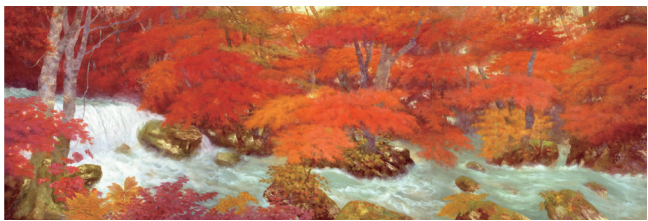
奥田元宋 「奥入瀬(秋)」