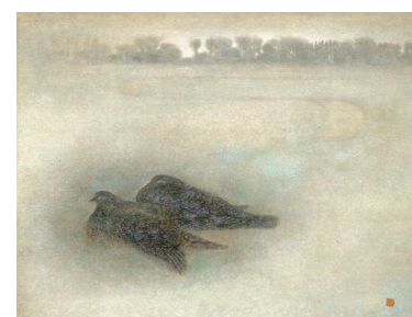
高山辰雄 「春を聴く」